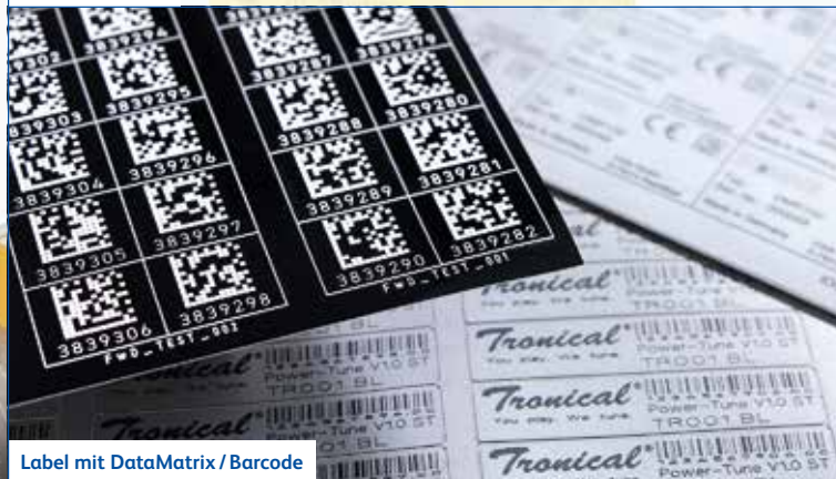
Label mit DataMatrix / Barcode